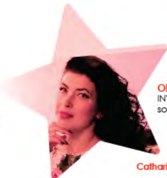
Olga YURINA INVITÉE SPÉCIALE soprano